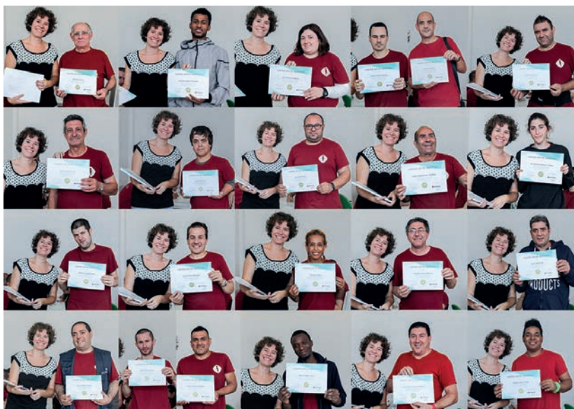
Entrega de diplomas

Por este motivo, consideramos que era necesario impartir un taller de manipulado de alimentos para los trabajadores de Stylepack Zaragoza y La Rioja.