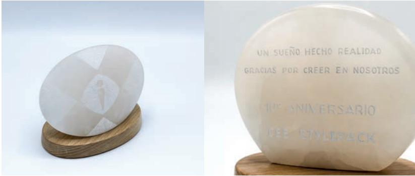
Premio conmemorativo realizado por uno de nuestros trabajadores