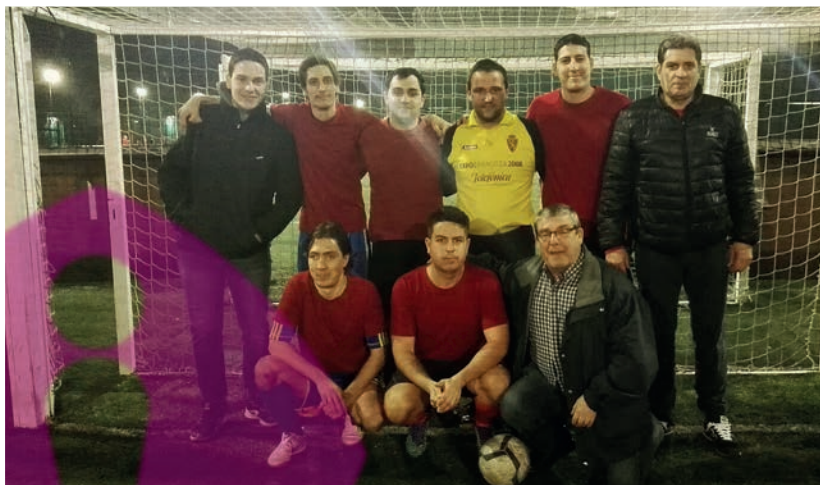
El equipo de fútbol de los trabajadores de la Corporación Diversis