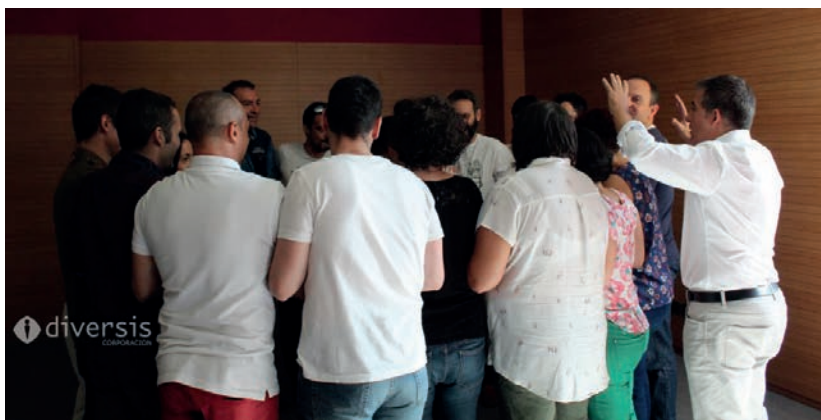
Jornada de team building