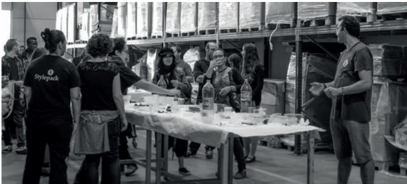
Celebración del décimo aniversario con todos los trabajadores